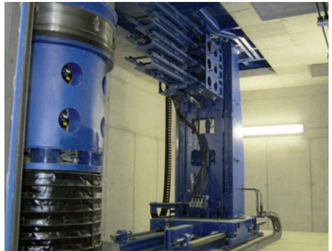
Automatisches Bügelmagazin für die Schachtring- und Konenfertigung