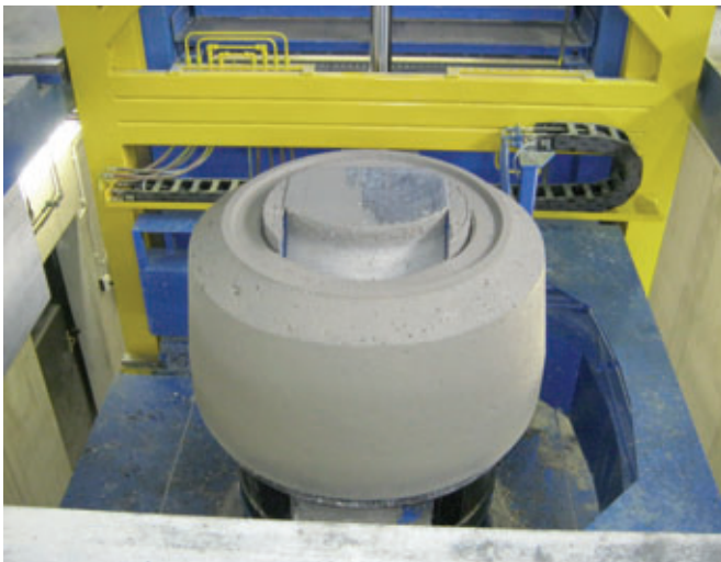
Schachtkonus beim Entschalvorgang in der Tornado. Mit der Tornado fertigt Dolomit das ganze Schachtprogramm: Konen, Ringe und Unterteile