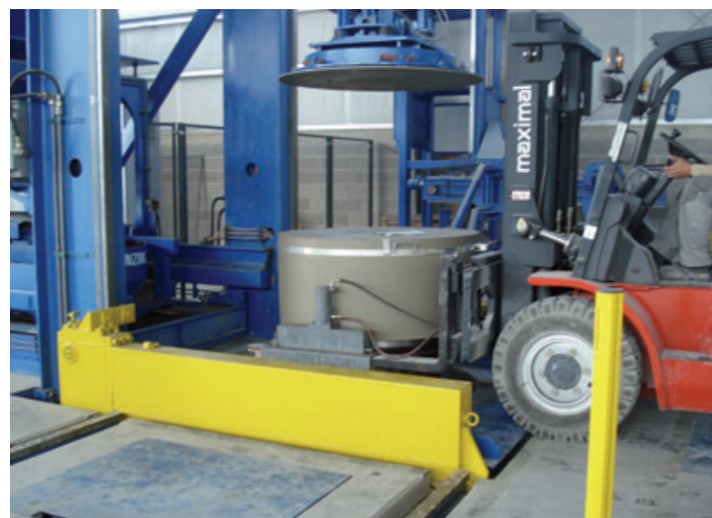
Entnahme des Bodenteilrohlings aus der Tornado

Je nach Mischungszusammensetzung haben die Betonrohlinge bereits nach 60 Minuten eine ausreichende Festigkeit erreicht.