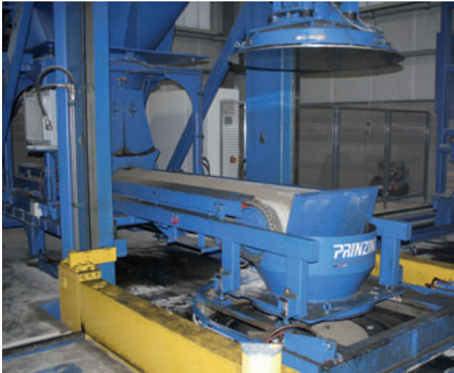
Dosierklappen unter dem Betonvorratsbehälter sorgen für eine optimierte Befüllung der Form