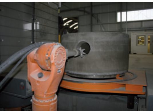
Ist ein Anschluss fertig gefräst, fährt der Roboterarm zurück und der Schacht wird automatisch in die nächste Fräsposition gedreht.

Prinzing GmbH Anlagentechnik und Formenbau Zum Weißen Jura 3 · 89143 Blaubeuren, Deutschland T +49 7344 1720 · F +49 7344 17280 info@prinzing-gmbh.de · www.prinzing-gmbh.de www.top-werk.com