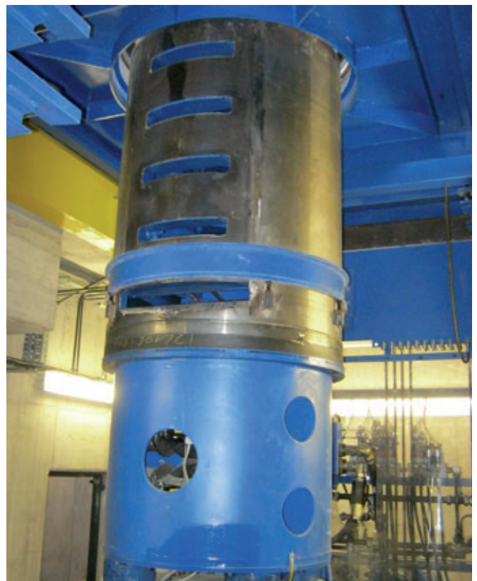
Schachtringformkern für die Direkteinrüttlung von Steigbügeln