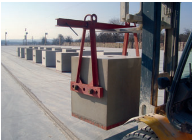
Sonderbauteile aus SVB – auch eine Spezialität von Dolomit

Dolomit Kft. ist ein zertifiziertes Unternehmen und stellt sehr hohe Ansprüche an die Betonqualitäten. Produziert wird bis zur Betonfestigkeitsklasse C 100/115. Eine externe Überwachung der Betongüte ist für das Unternehmen dabei selbstverständlich. Obwohl das junge Unternehmen noch nicht