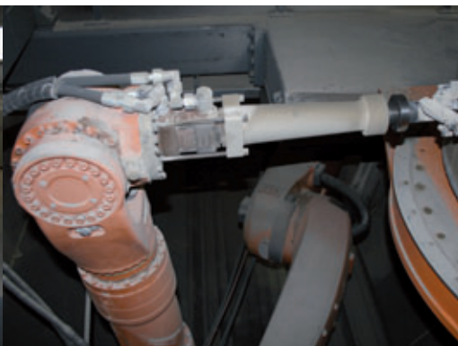
Das Fräsgut fällt direkt in die Arbeitsgrube, das Fließband am Boden sorgt für den kontinuierlichen Abtransport.