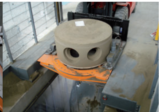
Entnahme des gefrästen Schachtunterteils aus der Primuss