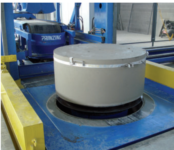
Entschalter Schachtunterteilrohling. Nach einer kurzen Aushärtezeit kann der Rohling in die Frässtation gebracht werden.

Über einen rotierenden Sprühmechanismus werden die Muffen dort schnell und präzise mit Trennmittel versehen. Die so vorbereiteten Muffen können dann mit dem Muffeneinleger in die Tornado geschoben werden. Kurze Formwechselzeiten ermöglichen eine wirtschaftliche Produktion mit häufigem Dimensionswechsel, die stufenlose Bauhöhenautomatik eine variable Fertigung von Schachtelementen.