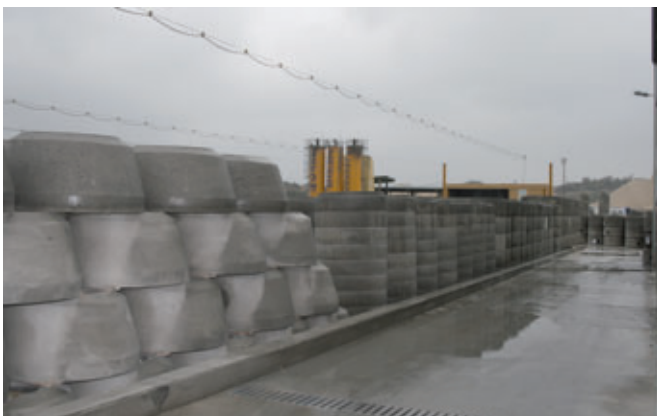
Dolomit bietet jetzt das komplette Betonschachtprogramm.